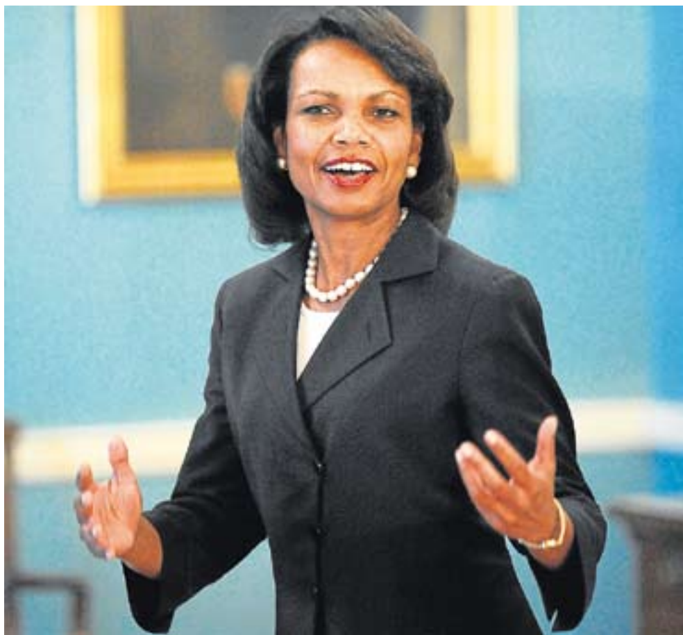
Condoleezza Rice ha dicho que su país "está decidido a llegar al pueblo iraní".

Estudia abrir una sección de intereses, similar a una embajada