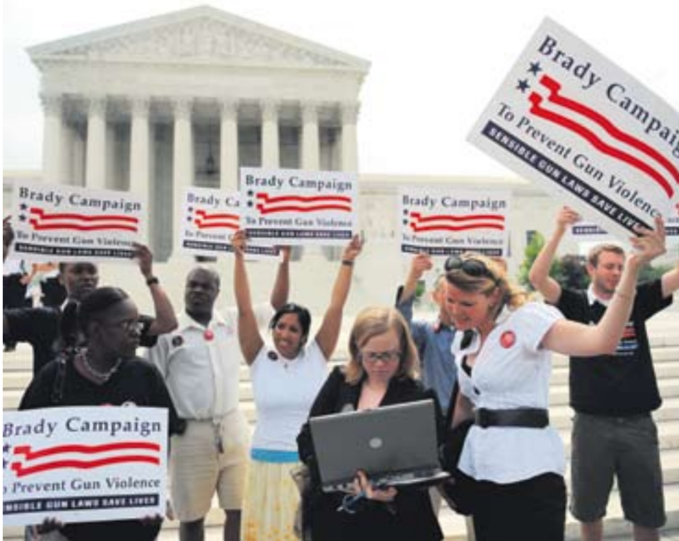
Manifestantes contra las armas, ante la sede del Tribunal Supremo.

Los magistrados no anulan las leyes que limitan la venta de armamento