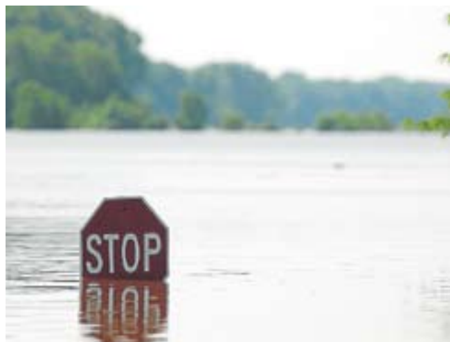
El desbordamiento del río Mississippi causa estragos.

WASHINGTON // El cauce del río Mississippi, cuya crecida devastó el sureste de Iowa a principios de esta semana, rebasó ayer decenas de diques e inundó tierras de cultivo en Illinois y ahora amenaza a Missouri. La situación puede complicarse, ya que el Servicio Meteorológico ha pronosticado más lluvias en una región donde dos millones de hectáreas ya se encuentran bajo las aguas.