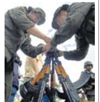
Soldados en Colombia.