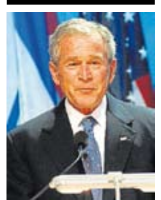
Bush, de gira en Israel.