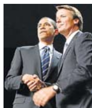
Obama y Edwards.

“Cuando termine el proceso de nominación tendremos que estar unidos con el profundo convencimiento de que