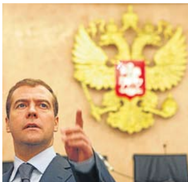
Medvédev pretende aumentar la seguridad jurídica.

Las detenciones preocupan a los inversores extranjeros en Rusia, ya que se teme una maniobra desde el Kremlin para hacerse con la parte de BP