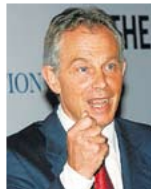
Blair habla del clima, no de Irak.