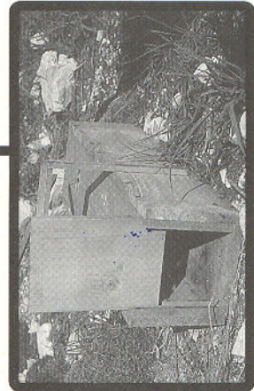
Gàbia trampa, mètode legal

L'enverinament de polls al niu és desgraciadament freqüent. Aquestes pràctiques causen a les espècies un mal que pot ser decisiu per a la seva supervivència.